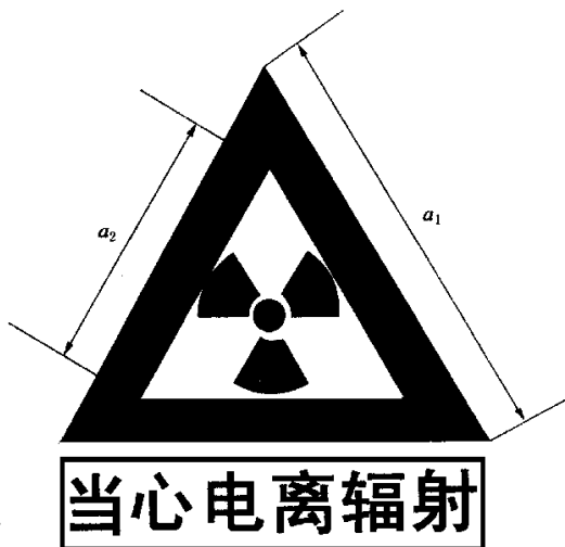
图 F2 电离辐射警告标志

电离辐射的警告标志如图 F2 所示。警告标志的含义是使人们注意可能发生的危险。其背景为黄色，正三角形边框及电离辐射标志图形均为黑色，“当心电离辐射”用黑色粗等线体字。正三角形外边 a_1 = 0.034L ，内边 a_2 = 0.700a_1 ， L 为观察距离。